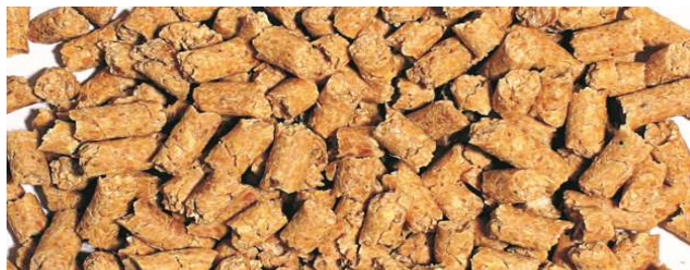
Pellets 5 mm